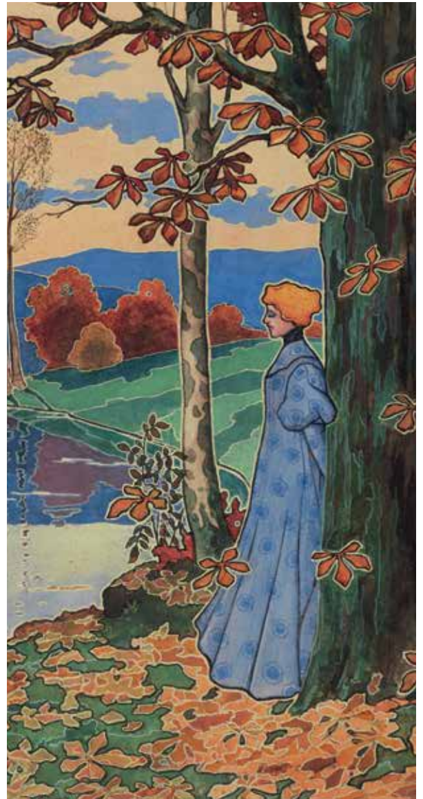
L'automne, vers 1900. Ref. 24532