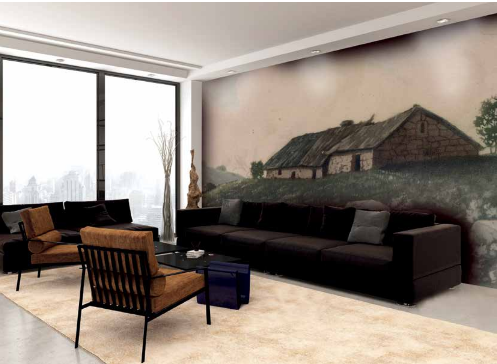
Chaumière à Labaroche, 1908. Ref. 24537