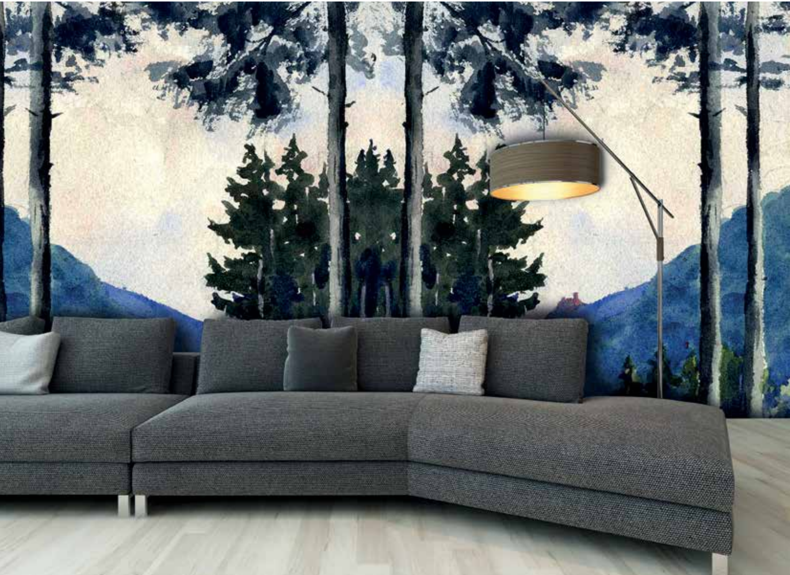
Un chemin vers les châteaux de Ribeauvillé, vers 1909. Ref. 24501

En plus des aquarelles et autres peintures délicates, l'oeuvre de Hansi se retrouve également dans de nombreux supports publicitaires. Le logo des "Potasses d'Alsace" comme les affiches de nombreuses Caves ou Sociétés d'expositions portent l'empreinte de cet artiste, si reconnaissable.