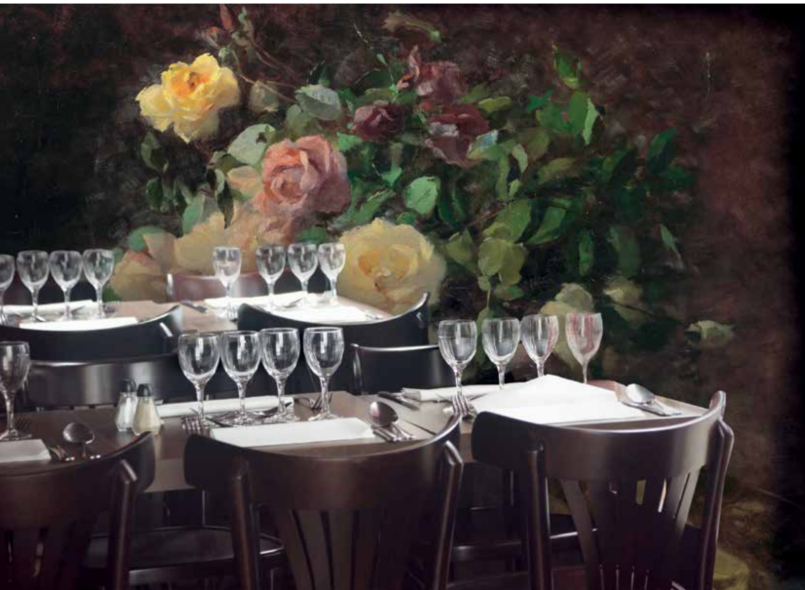
Bouquet de roses, 1894. Ref. 24500

Qualité, toutes nos impressions sont garanties A+