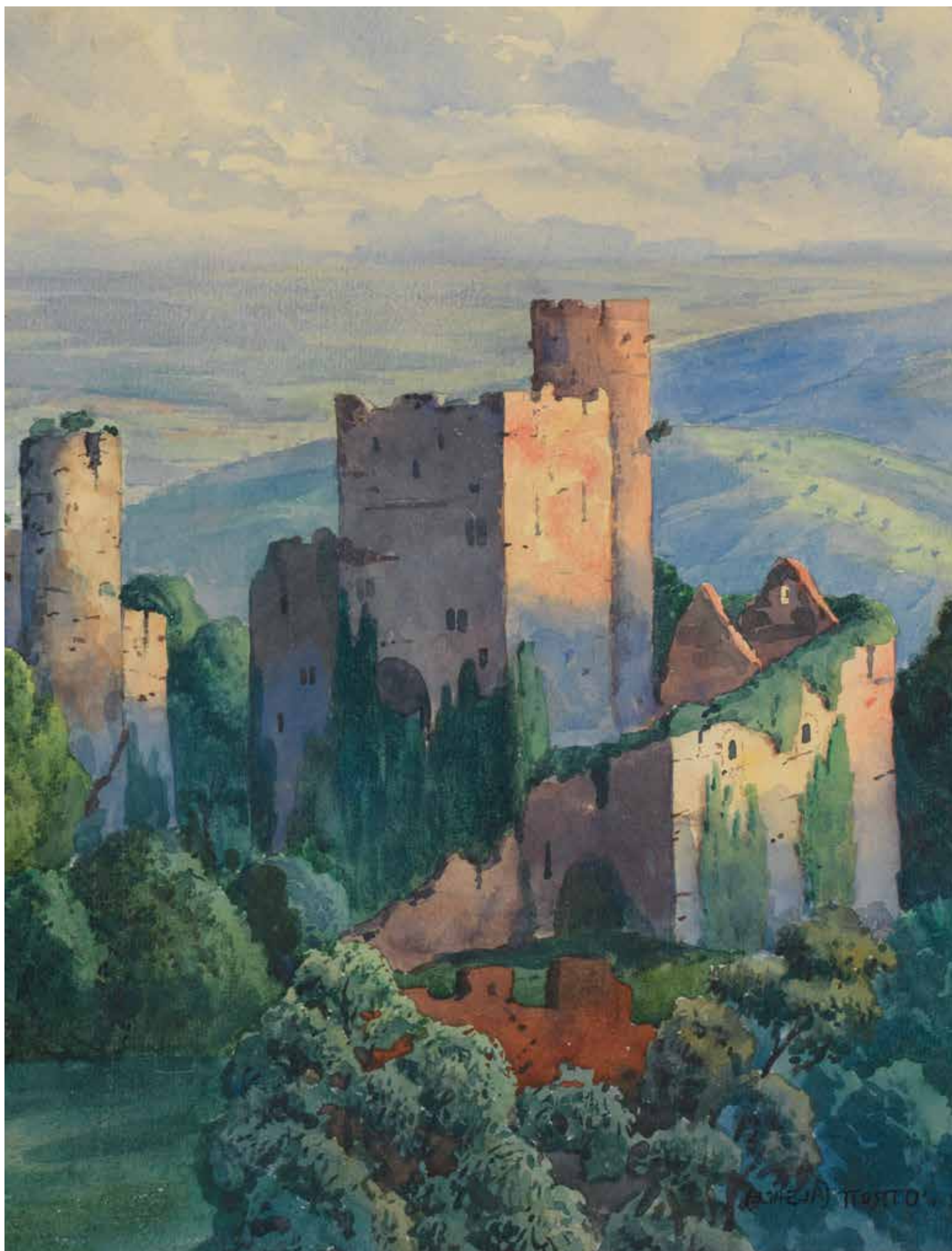
Châteaux d'Ottrot, 1908. Ref. 24534