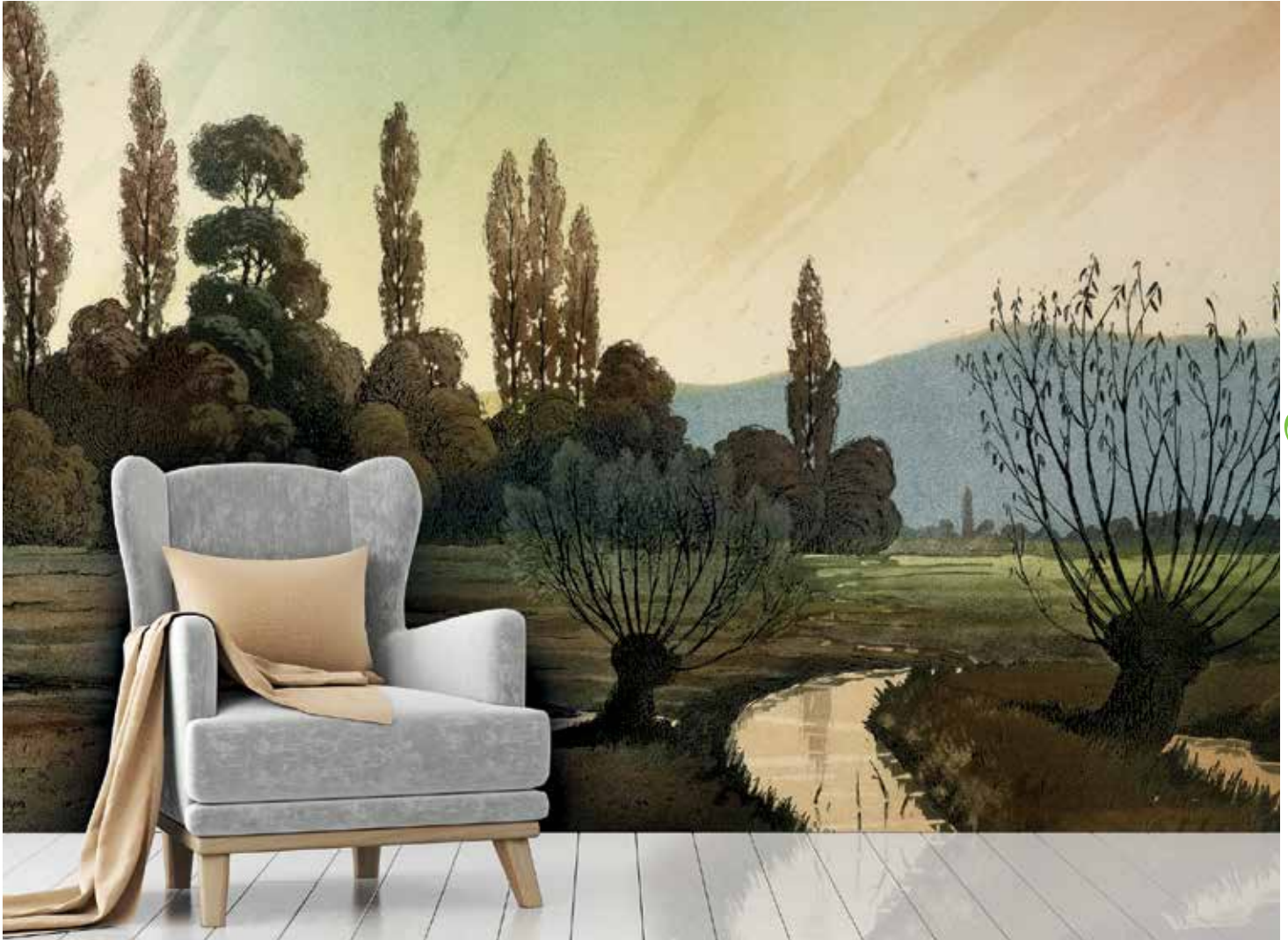
Ruisseau et arbres, près de Herrlisheim. 1909. Ref. 24538