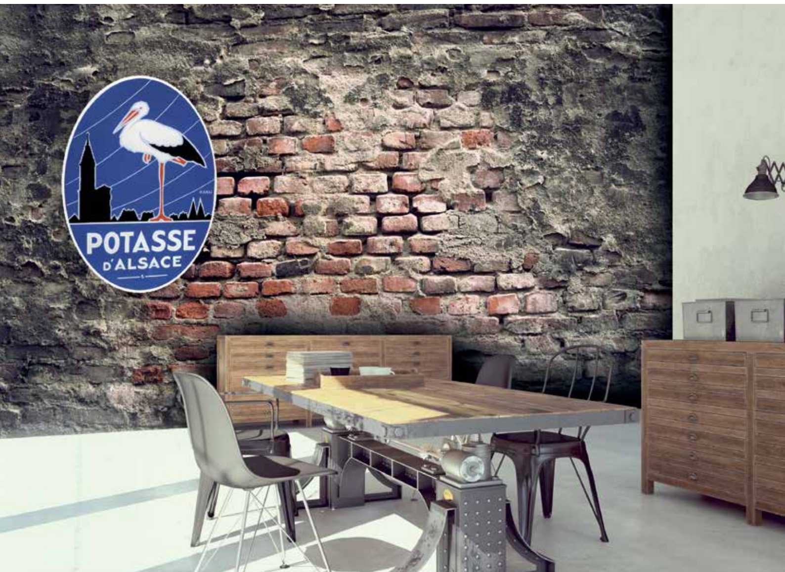
Potasse d'Alsace, 1930. Ref. 24548. Oeuvre mixée au fond brique de la collection Matières Ref. BEK10.