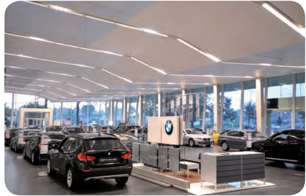
arch. : FRAP