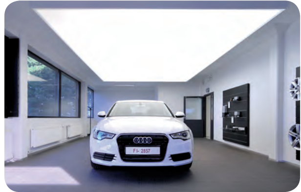
arch. : Petri Ilmarinen, Architect Bureau DPI-U2