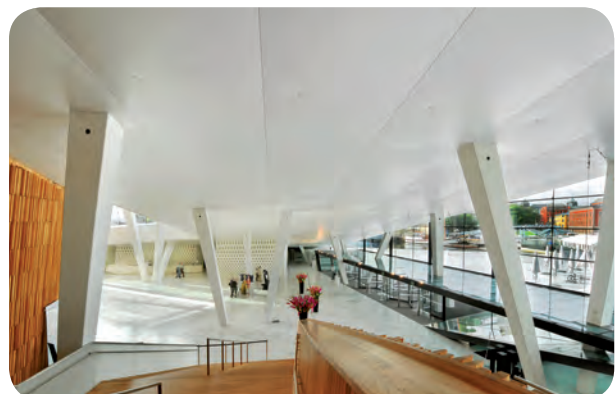
Opéra d'Oslo - arch. : Snohetta Architects Prix européen d'architecture contemporaine 2009