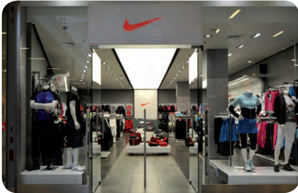
arch. : Joanna Smagala