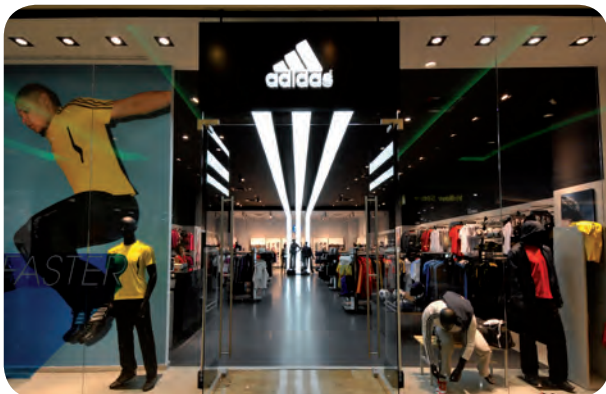
arch. : Adidas International