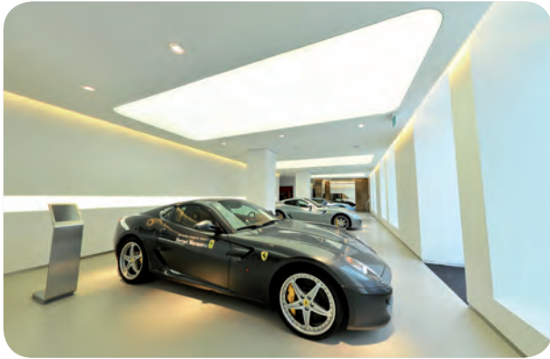
arch. : S. Franci