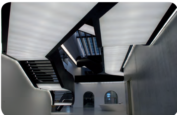
Musée MaXXI Rome - arch. : Zaha Hadid Prix RIBA Stirling 2010