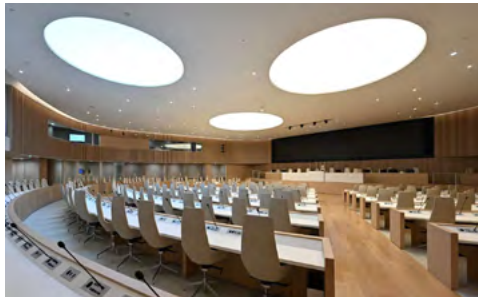
Realisation : Barrisol®