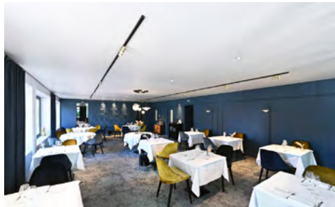
Arch. : L'Atelier d'architecture Herrgott & Farabosc