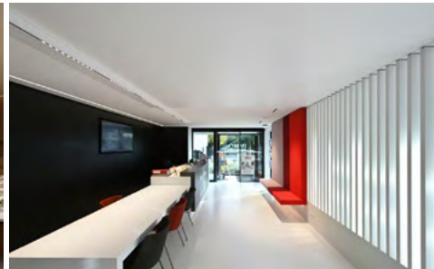
Arch. : Frank Sinnaeve