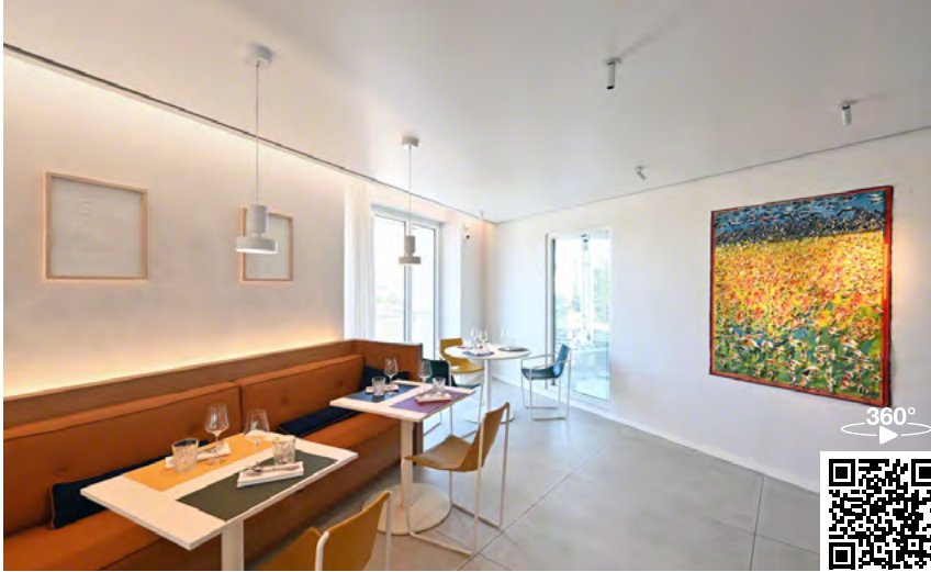
Arch. : Pauline Percheron (Restaurant) - Sou Fujimoto - Nicolas Laisné - Manal Rachdi

La toile biowood tout comme la toile biosourcée est le produit idéal pour le Barrisol Clim®. Les tests garantissant la climatisation ont été réalisés avec la toile Biosourcée®, il est donc le produit idéal, de par sa composition, pour le Barrisol® Clim®.