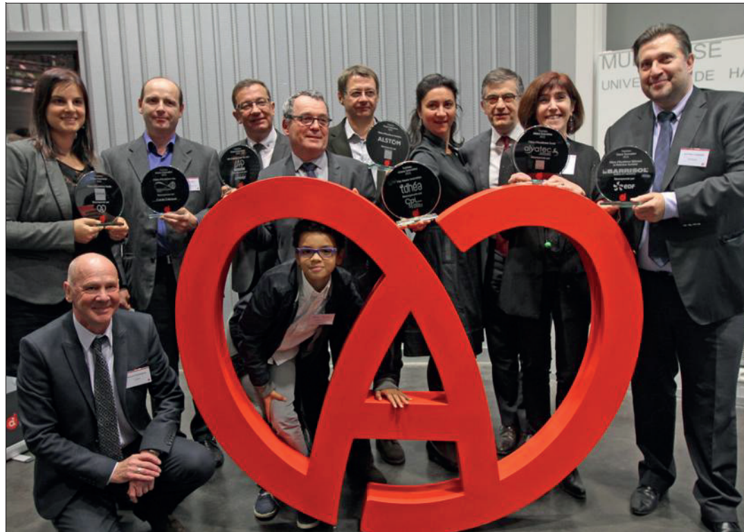
L'ensemble des lauréats des 12 es trophées d'Alsace Innovation.

Pour cette édition 2015, 51 dossiers avaient été déposés, entrant chacun dans l'une des six thématiques proposées : santé, bâtiment et matériaux durables, mobilité, eau, textile et « généraliste ». Une présélection a été réalisée et 33 des projets présentés ont fait l'objet d'une analyse approfondie, portée conjointement par les experts d'Alsace Innovation et les pôles de compétitivité correspondant à chaque dossier. Puis le jury régional