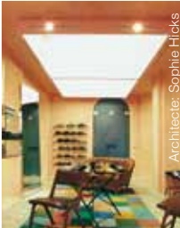
Architecte: Sophie Hicks

Für ausführliche Informationen über unsere Technik, unsere Produkte und unser dichtes Vertriebspartnernetz senden Sie uns bitte das nachstehende Formular ausgefüllt per Post, Fax oder E-Mail.