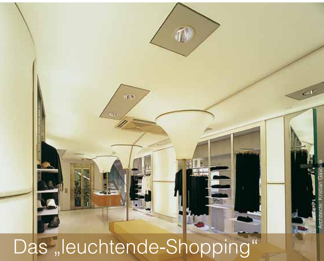
Architecte: Kristian Gavølle