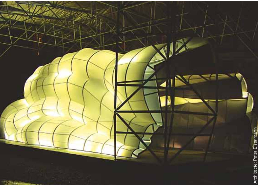
Architecte: Peter Eisenmann